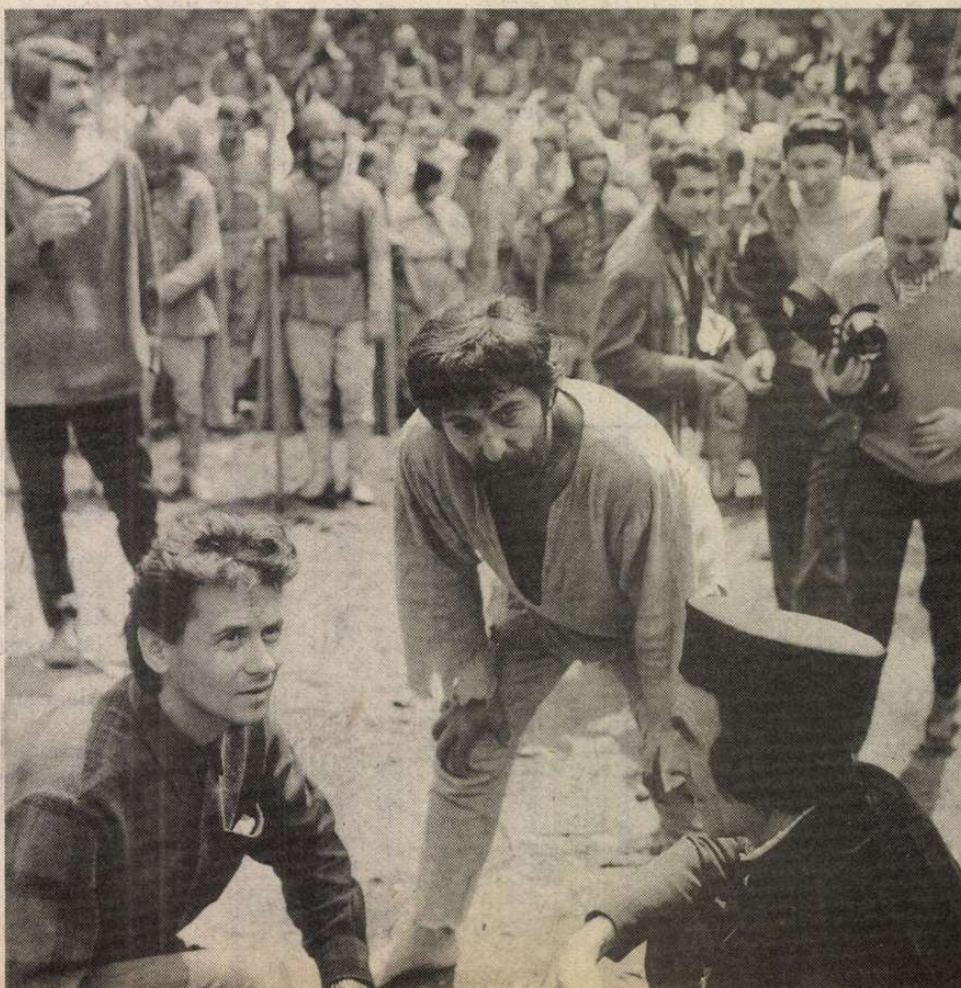
Az Ítélet című film forgatásán

nak csak javára válhat, ha körülötte vita bontakozik ki. Különösen ha Dózsáról szól, hiszen egy ilyen vállalkozás — nem beszélve várható rendkívül nagy költségeiről — mindenekelőtt ideológiai értelemben közügy. Ezért tartozunk köszönettel Rényi Péternek, hogy belső hevülettel és szuggesztív gondolatmenetben tárta fel aggodalmát: a film egy parasztforradalom belső gyengeségeiből eredő »abszolút erőszakot« glorifikál; elidegenítő, távlatérzékeltető ábrázolás híján azonosul egy parasztforradalom önpusztító kényszerével-sodrásával; a kritikailag átértékelt tanulságai helyett eszményként idézi »semmire sem tekintő fanatizmusát«. Így rokonul a film sugallata —